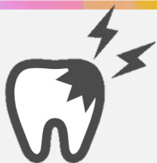
虫歯予測チェック