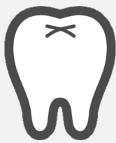
歯の出血度チェック